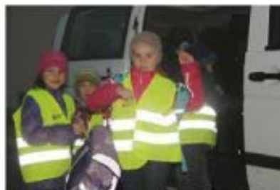
Der OÖ Zivilschutz verteilt zu Schulbeginn Warnwesten an die Schulanfänger