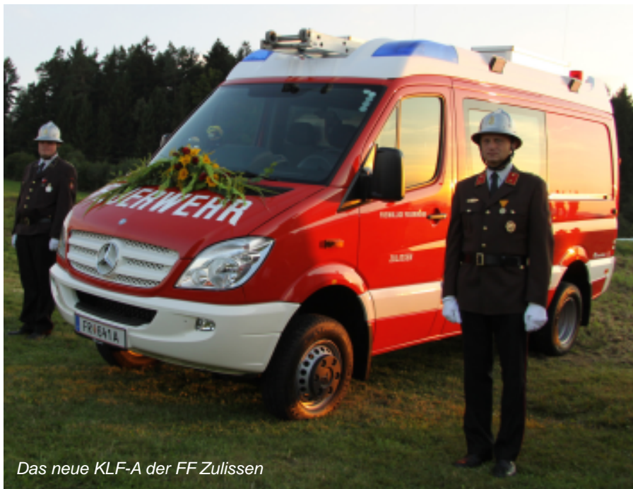
Das neue KLF-A der FF Zulissen