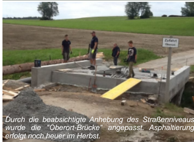
Durch die beabsichtigte Anhebung des Straßenniveaus wurde die "Oberort-Brücke" angepasst. Asphaltierung erfolgt noch heuer im Herbst.