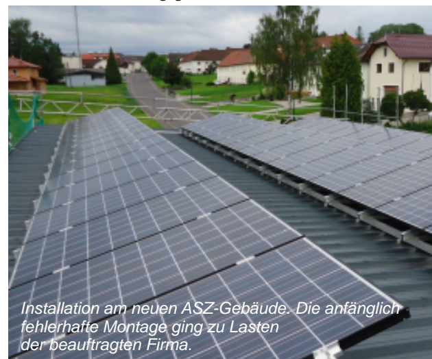
Installation am neuen ASZ-Gebäude. Die anfänglich fehlerhafte Montage ging zu Lasten der beauftragten Firma.

Insgesamt fünf PV-Anlagen werden derzeit auf Gemeindeliegenschaften realisiert. Vier Standorte davon betreibt die Firma Helios Sonnenstrom GmbH (mittels Dachflächenüberlassungs- und Nutzungsvertrag). Diese sind am ASZ-Gebäude, am Schulkomplex, beim Wasserhaus Summerau, sowie beim Tiefbrunnen in der Pirau - mit einer Gesamtleistung von 100 kW(peak). Die 10 kW-Anlage am Kindergartengebäude errichtet und unterhält die Gemeinde selbst. Diese wird in den Ferienwochen fertig gestellt.