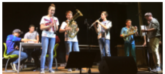
Musical der NMS "Die Traumschule"