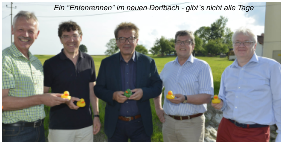
Ein "Entenrennen" im neuen Dorfbach - gibt's nicht alle Tage