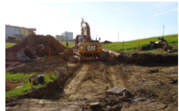
Siedlungserweiterung Sonnenhang: weitere 8 Parzellen konnten geschaffen werden, demnächst beginnen die Arbeiten des ersten "Häuslbauers"