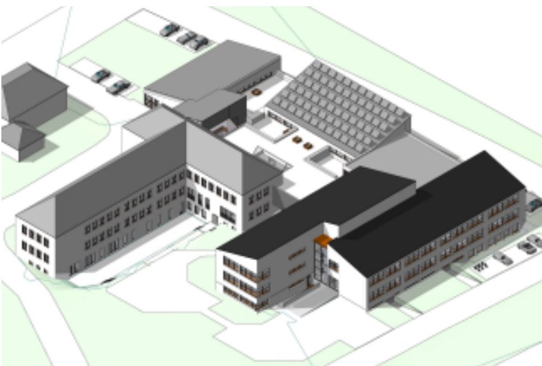
Hochwertige Schulsanierung: das Modell des "Null-Energie-Hauses" wurde am 4. Juni dem Gemeinderat, sowie der Lehrerschaft vorgestellt. Die Bauarbeiten beginnen beim Turnsaalkomplex im Herbst 2012.