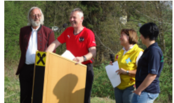
Eröffnung des Nord-Wald-Kamm-Wanderweges im Mai 2012.