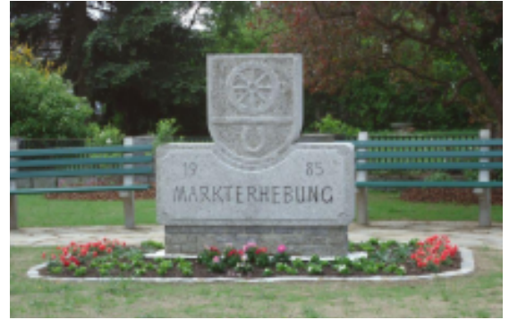
Ortszentrum etwas umgestaltet: Anstatt des Brunnens, welcher in den letzten Jahren zu hohe Wartungsintervalle verursachte, wurde der Markterhebungsstein in die Mitte gerückt.