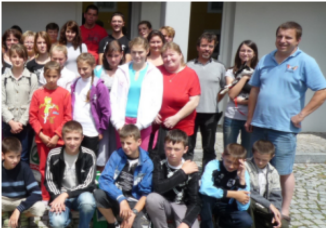
Bildtext: Zwischen den Kindern aus OÖ und den Landlerdörfern sind schon viele schöne Freundschaften entstanden.

An die 100 Kinder und Jugendliche, im Alter von 8 bis 14 Jahren, kommen zwischen Freitag 6. Juli und Freitag 27. Juli 2012 nach Oberösterreich. Die OÖ. Landlerhilfe sucht nun Familien, die ein Mädchen oder einen Buben aus den Landlerdörfern Großau, Großpold und Neppendorf in Siebenbürgen, aus Oberwischau / Nordrumänien oder aus Königsfeld bzw. Deutsch – Mokra in den ukrainischen Waldkarpaten bei sich aufnehmen möchten. Die An- und Abreise der Kinder erfolgt mit Reisebussen. Die Kinder sprechen Deutsch als Muttersprache oder lernen die Sprache in der Schule. Ziel der Ferienaktion ist die Verbesserung der Deutschkenntnisse der rumänischen bzw. ukrainischen Teilnehmer, sowie der Aufbau von Freundschaften zwischen Kindern und Familien aus Oberösterreich und den Heimatregionen der Landler. Anmeldungen bzw. Auskünfte unter 0732 / 60 50 20 oder E-mail: sabine.moser@landlerhilfe.at